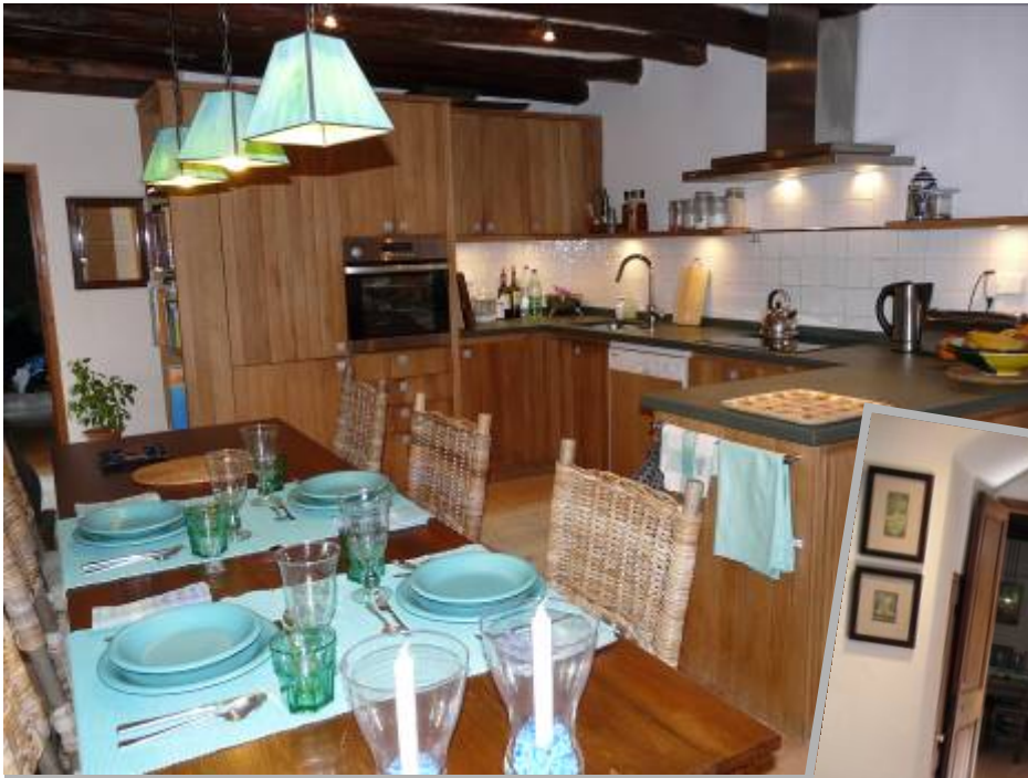
Heizung und zwei Kamine, Fernsehen mit Satellitenempfang, Wifi im ganzen Haus.