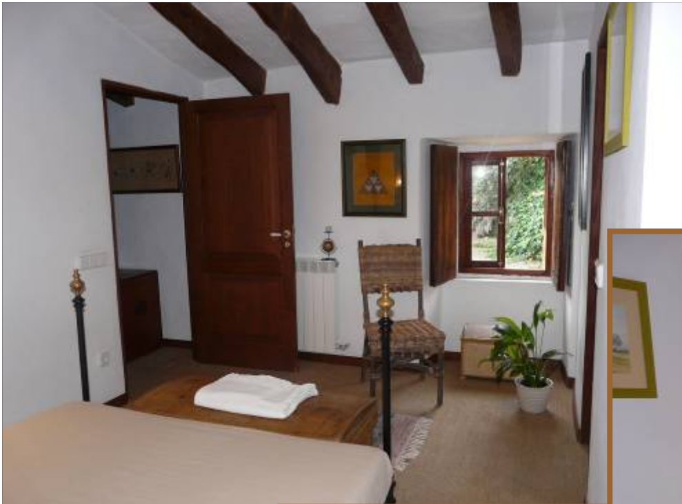
Kleines Zimmer im ersten Stock