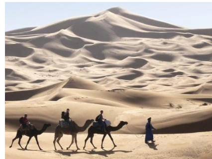
Sanddünen bei Merzouga

Sie unternehmen einen Rundgang durch die Oase von Merzouga. Am Nachmittag reiten Sie auf Kamelen zum Camp in die Dünen, wo Sie die Nacht verbringen. Genießen Sie das Erlebnis eines tiefroten Sonnenuntergangs und einer Nacht am Lagerfeuer unter dem Sternenhimmel!