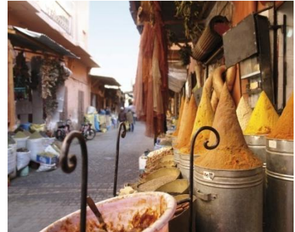
Strasse in der Altstadt von Marrakechj

Ankunft am Flughafen von Marrakech und Transfer zu Ihrer Unterkunft. Am Nachmittag besteht die Möglichkeit erste Besichtigungen in der Stadt zu unternehmen.