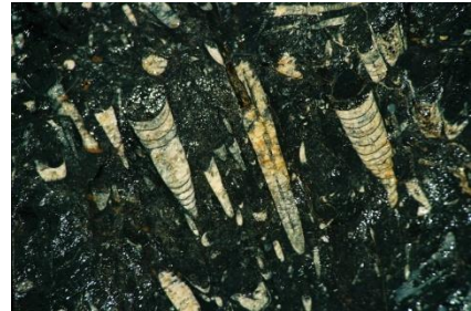
Fossilienfunde bei Erfoud

Aus einer von bunten Farbtupfern der Oasen, kleinen Dörfern und Kasbahs geprägten Landschaft erreichen Sie heute das Oasengebiet Tafilalet. Sie besuchen die Fossiliensteinbrüche von Erfoud. In der Ferne tauchen bereits die Sanddünen des Erg Chebbi auf. Auf einer Piste fahren Sie durch die Steinwüste entlang dieses Sanddünengebiets nach Merzouga und verbringen hier die Nacht in einer komfortablen Herberge am Rande der Sandwüste.