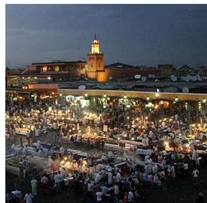
Jemaa el Fna am Abend

Es ist Markttag in Agdz. Bei einem Bummel über den Markt bekommen Sie einen authentischen Eindruck von den Märkten, wie sie seit hundert Jahren im Süden Marokkos stattfinden. Anschließend sehen Sie die Kasbah Ait Benhaddou. Diese beeindruckende Berbersiedlung diente schon vielen bekannten Spielfilmen als Kulisse. Sie fahren über den bekannten Tizi-n-Tichka Pass. Er windet sich in vielen Serpentinien bis in eine Höhe von 2260 Meter. Sie erreichen den Ausgangspunkt Ihrer Reise, das beeindruckende Marrakech.