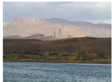
Bergsee bei Imilchil

Sie sind im zentralen Hohen Atlas. Über das „Plateau der Bergseen“ fahren Sie bis zum 2700 Meter hohen Tizi Tirherhouzine Pass. Auf dem Weg nach Süden geht es hinab zur Todraschlucht. Hier unternehmen Sie einen Spaziergang durch die Oasengärten der palmenbewachsenen Flussoase bis zu Ihrer Unterkunft.